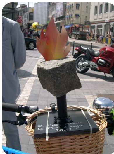
Action "Pavé de l'enfer" - Ixelles 2012