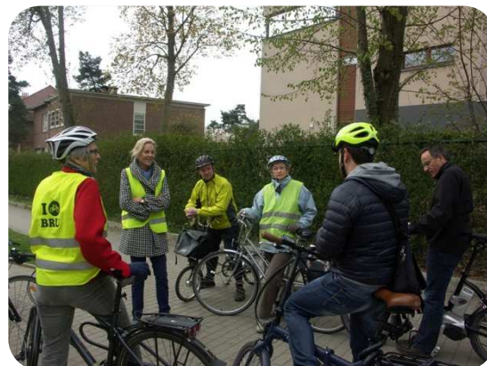
Uccle - balade avec les élus