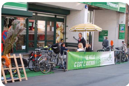
Parking Day - Ciney 2012

► Park(ing) Day est un événement mondial qui a lieu chaque année le troisième week-end de septembre et sensibilise au partage de l'espace public.