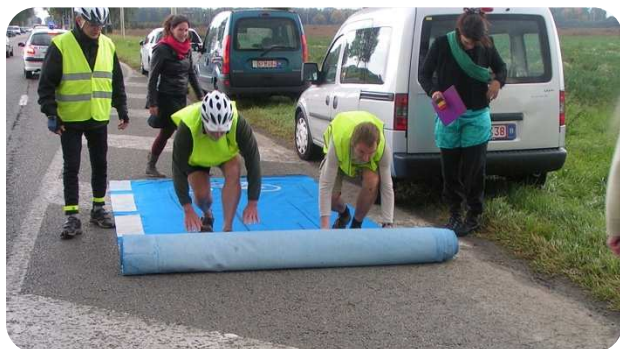
Inaugur'Action - Louvain-la-Neuve

Une Inaugur'Action est une action médiatique pour attirer l'attention du public sur l'absence d'infrastructure cyclable à un endroit clé de votre commune et pour faire pression sur les politiques en montrant la nécessité de cette infrastructure.