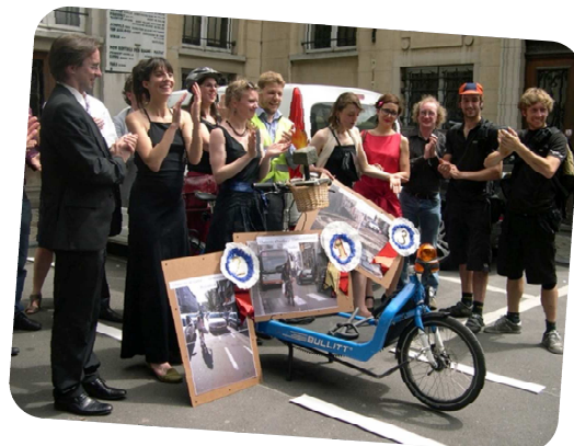
Action "Pavé de l'enfer" - Ixelles 2012