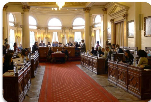
Interpellation à Ixelles