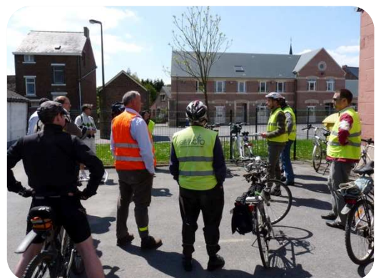
Chastre 2012 - Balade Memorandum

► Le GRACQ Chastre a organisé des rencontres individuelles de deux heures avec les différents partis politiques pour présenter son mémorandum. La locale leur a ensuite écrit pour évaluer leur soutien à son mémorandum et plus tard, a présenté le mémorandum « sur le terrain » en présence des candidats aux élections et de citoyens.