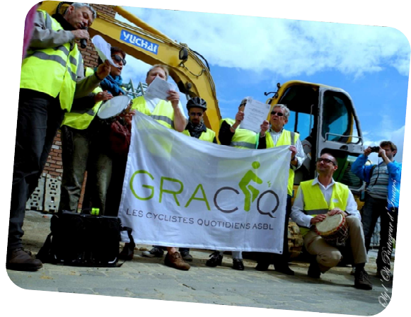
La plainte des cyclistes nivellois

DOCUMENT 3 - La plainte des cyclistes nivellois